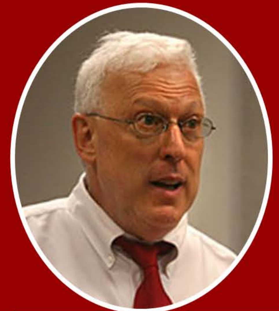
Robert J. Sternberg

El proceso de evaluación dentro de este enfoque, de acuerdo con una analogía utilizada por Sternberg y Grigorenko (2003), adopta la forma de sándwich o de tarta. En el primer caso se evalúa al alumno con pruebas convencionales y luego se le entrena en la realización de las distintas acciones que integran el proceso de solución de la tarea. En cuanto al segundo caso, se presenta al sujeto la tarea y se le van dando ayudas cada vez más específicas según las necesita –se van poniendo capas en la tarta-. Obviamente, tanto en un caso como en otro se requiere partir de un modelo del proceso cognitivo que permite resolver la tarea. El modelo proporciona al evaluador una serie de categorías que le permiten detectar en qué punto del proceso presenta dificultades el alumno, decidir qué ayudas dar y determinar si aquél se beneficia de las mismas. Varios autores han desarrollado procedimientos específicos de evaluación basados en las ideas anteriores (Feuerstein, Budoff, Campione y Brown, Guthke, Carson y Wiedl, y Swanson). ¿Ahora bien, ¿es efectiva la evaluación cuando se ajusta a este enfoque? ¿Qué ventajas ofrece y qué problemas plantea?