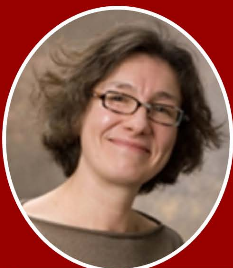
Elena L. Grigorenko

De acuerdo con la revisión llevada a cabo por Sternberg y Grigorenko (2003), los resultados no permiten dar una respuesta definitiva sobre la superioridad de la evaluación basada en este modelo frente a la más estática que busca la obtención de un perfil de puntuaciones en distintos factores intelectuales. No obstante, parece ser que el problema no está tanto en que la evaluación dinámica y las intervenciones basadas en la misma sean sea ineficaces cuanto en que la investigación no ha sido lo suficientemente rigurosa en cuanto a diseños, controles, etc. Por esta razón, teniendo en cuenta que la evaluación dinámica ha proporcionado resultados prometedores, los autores mencionados subrayan la importancia de continuar la investigación no sólo teniendo en cuenta características como tipo y tamaño de las muestras y poblaciones, controles metodológicos –estandarización de las ayudas, etc.–, sino también que la inteligencia es "experiencia en desarrollo". Este hecho implica, tal y como subrayó y demostró en su día Feuerstein, que la determinación de la bondad del modelo, más que hacerse midiendo los cambios que a corto plazo se producen tras un programa de intervención, debe hacerse a largo plazo, pues los programas lo que cambian no es lo que el sujeto sabe, sino su motivación y la capacidad de aprender, cambio que requiere tiempo para concretarse en avances notables, esto es, para "desarrollar la inteligencia".