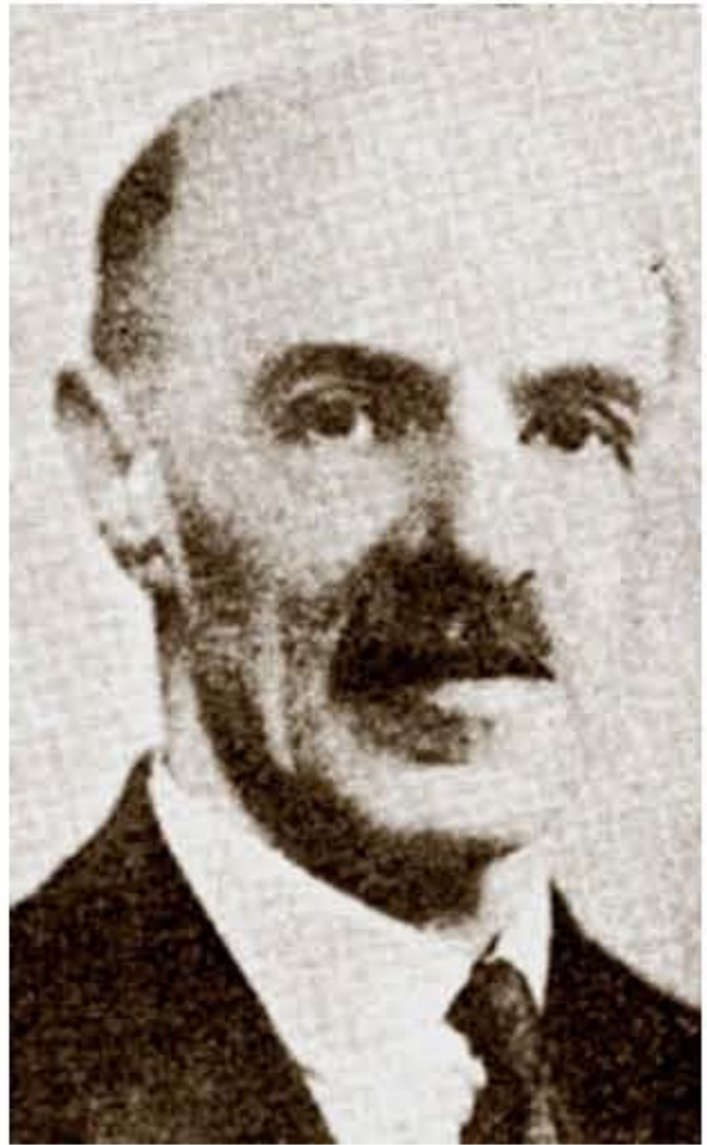
Charles E. Spearman (1863-1945)