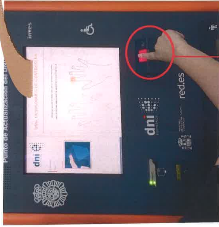
Lector de huella dactilar