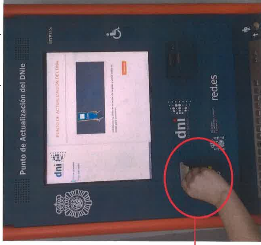
Lector de DNle