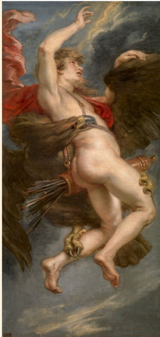
“El rapto de Ganimedes” – Pedro Paul Rubens (1638)

Sala de Conferencias – Facultad de Filosofía y Letras (UAM)