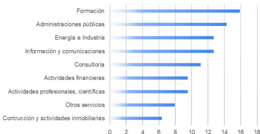
Figura 2. Principales actividades de los exalumnos de MEGIN (porcentajes)

Dentro de las empresas en las que realizan sus actividades, cabe destacar a Aena, BBVA, Mitsubishi Aircraft Corporation, Repsol o Telefónica. Mientras que algunos desarrollan actividades en organismos públicos tales como el Instituto Nacional Técnica Aeroespacial (INTA), ACCIÓ (Generalitat de Catalunya), Consejo Superior de Investigaciones Científicas (CSIC), y distintas Universidades tanto nacionales como extranjeras.