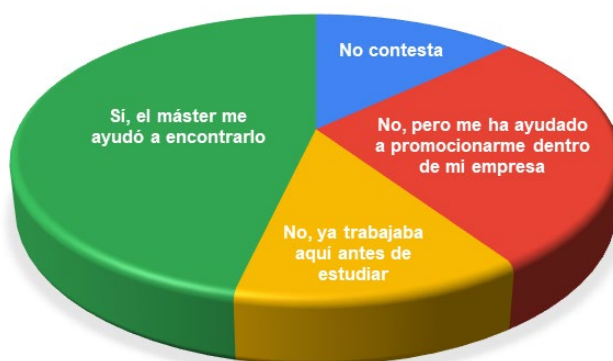
Figura 3. Relación entre acceso al empleo y MEGIN (porcentajes)

Dentro del conjunto de encuestados, más de dos terceras parte (73,9%) declara que su paso por MEGIN le ayudó a encontrar su trabajo actual, o a promocionarse dentro de su empresa. En la siguiente Figura 3 se muestran los resultados detallados a este respecto.