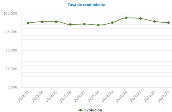
Gráfico 3. Evolución de la tasa de rendimiento

El siguiente gráfico muestra la evolución de la tasa de rendimiento: