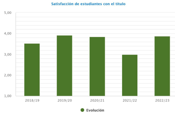
Gráfico 4. Evolución del índice de satisfacción de estudiantes con el Título