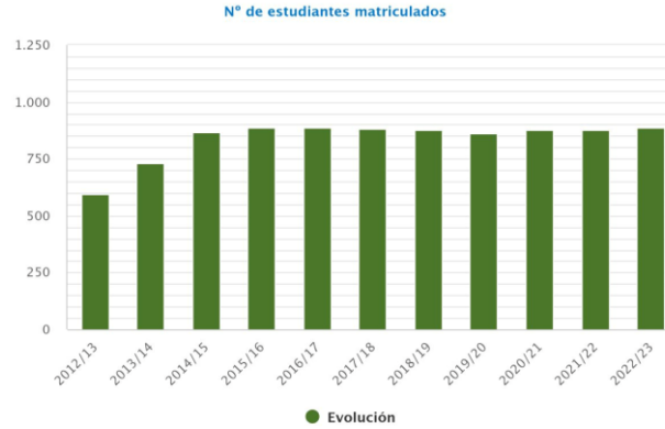
Gráfico 1. Evolución de estudiantes matriculados