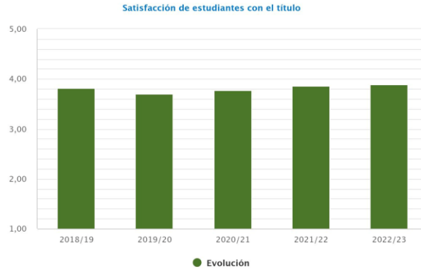
Gráfico 4. Evolución del índice de satisfacción de estudiantes con el Título

Cabe destacar la sustantiva mejora de la satisfacción de los estudiantes con el Título, que sube un 0,52% respecto del curso anterior.