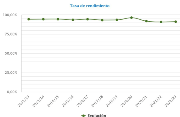
Gráfico 3. Evolución de la tasa de rendimiento

El siguiente gráfico muestra la evolución de la tasa de rendimiento: