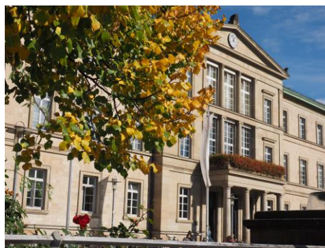
Eberhard Karls Universität, Neue Aula

La Universidad de Tubinga es una de las universidades alemanas más antiguas. Situada en el Land de Baden-Württemberg, es una universidad de excelencia, reconocida por su enseñanza en los campos de las ciencias naturales (por ejemplo, la medicina) y la filosofía.