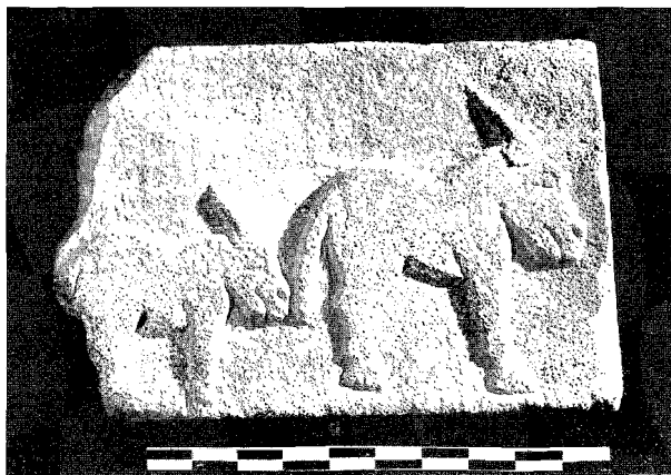
Figura 1. No todo son briosos corceles entre los équidos. En la economía diaria de los iberos los asnos y probablemente las mulas serían de una importancia comparable a la de los caballos. Santuario del Cigarralejo en Mula (Murcia).

das, puesto que hay al menos dos corrientes interpretativas recientes de enfoque muy distinto (en último lugar, Almagro Gorbea, 1995, 246 y 254 ss. vs. García-Bellido, 1993). No es por tanto ni siquiera necesario acudir como ejemplo de abundancia equina a los socorridos exvotos del santuario del Cigarralejo en Murcia, que en la mayoría de los casos parecen asociarse a un ambiente doméstico de carácter más humilde (Fig. 1). Por lo que se refiere al carácter militar o guerrero de la aristocracia ibérica, baste con remitir a la principal bibliografía reciente (entre otras muchas obras, Quesada, 1997, 605 ss.; Blánquez y Antona (eds.), 1992; Almagro Gorbea, 1996; Olmos (ed.) 1992).