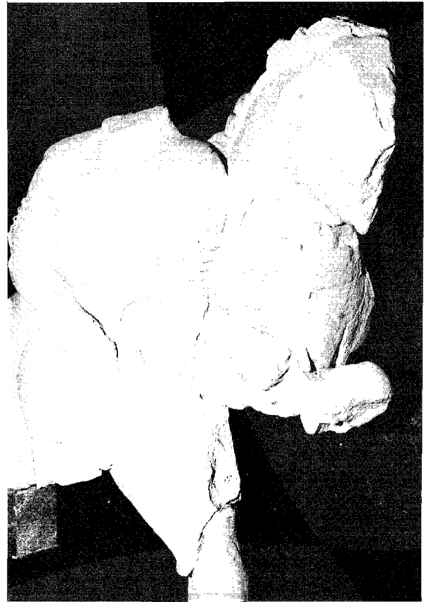
Figura 2. Durante el s. V a.C. el guerrero noble combatía a pie aunque marchara al combate en su caballo. Esta escultura de Porcuna no pretende representar una situación real de combate, sino que sintetiza los elementos y costumbres que caracterizan al aristócrata: el caballo y las armas, la equitación y la guerra. Conjunto de Porcuna, s. V a.C.

Aunque pudiera parecer lo contrario en un análisis superficial, el caso del conocido guerrero de Porcuna que remata a un enemigo caído mientras sujeta su caballo por las riendas (Negeruela, 1990, Fig. 30. guerreros nos. 4-5) viene a confirmar la ausencia del empleo del caballo como elemento táctico en el campo de batalla. En efecto, el combatiente se representa luchando a pie y venciendo a su enemigo con una lanza empuñada (Fig. 2); es evidente que no se puede combatir a pie mientras se sujeta con la siniestra un caballo y un escudo: lo que el grupo escultórico pretende representar, de manera sintética, son los elementos claves de la concepción aristocrática de lo que es un guerrero noble: es un caballero que marcha al combate a caballo, elevado física y conceptualmente sobre las cabezas de los demás, pero que desmonta al llegar al campo de batalla y lucha a pie. De hecho, más adelante veremos que las fuentes