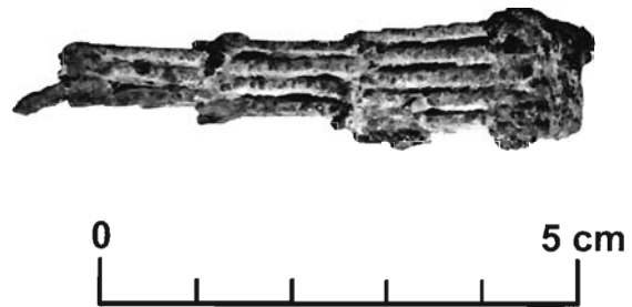
Lámina 2. Espuela articulada procedente probablemente de la necrópolis del Cerro del Santuario de Baza (Granada). Vista lateral. Museo de Baza.

aprecia perfectamente (lám. 2) el arranque de uno de los dos anillos terminales de bronce que, unidos a los segmentos anteriores por un pasador férreo idéntico a los anteriores, constituían los últimos segmentos articulados que servían para pasar la correa de cuero que ataba y fijaba la espuela al tobillo (ver fig. 1.A). Extendida la pieza debía medir, completa, unos 15,8 cm de extremo a extremo de los anillos.