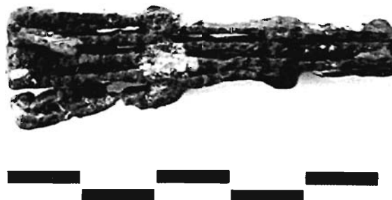
Lámina 4. Espuela articulada de la Sep. 70 de Coimbra. Museo de Jumilla.

El principal problema que plantea el contexto arqueológico de esta espuela es que parece indudable que la Sep. 70 fue un enterramiento de ajuar claramen-