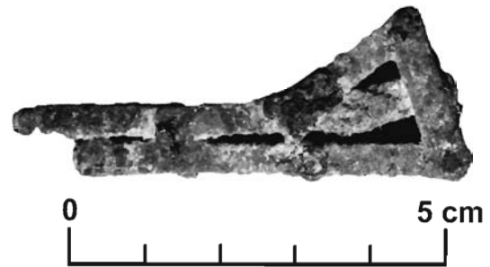
Lámina 1. Espuela articulada procedente probablemente de la necrópolis del Cerro del Santuario de Baza (Granada). Vista superior. Museo de Baza.