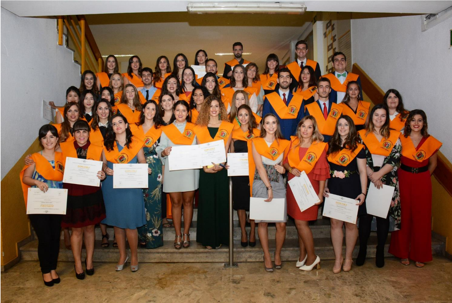
Acto de graduación · Grado en Turismo. Oct. 2016