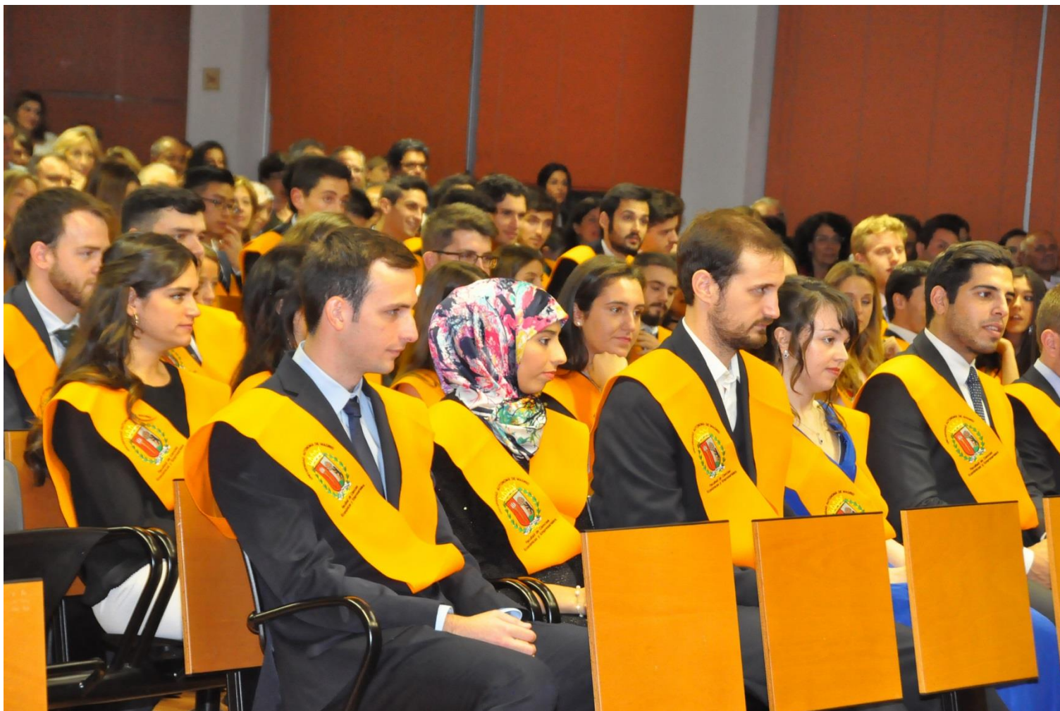
Acto de graduación · Grados en Economía y en Economía y Finanzas. Oct. 2016