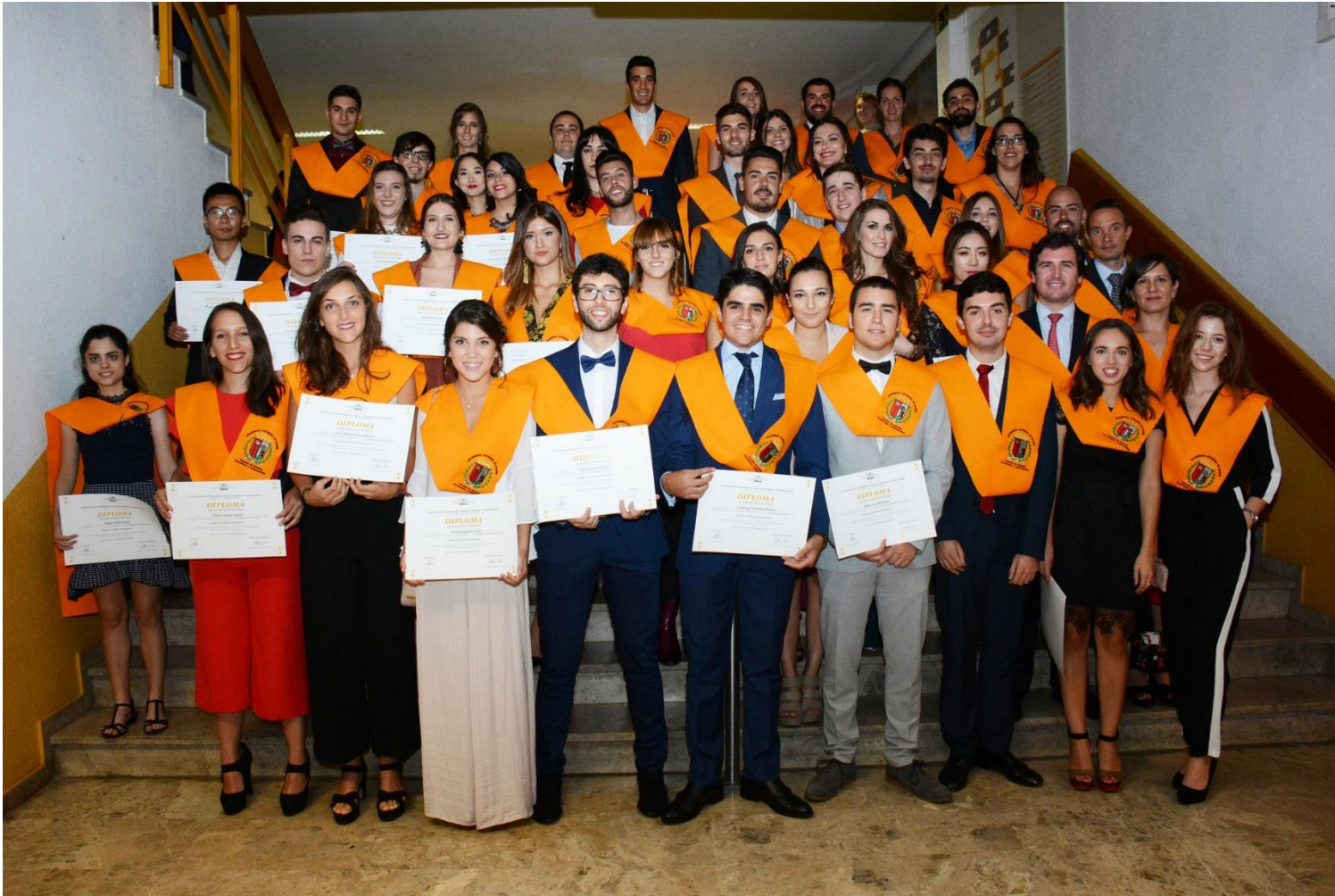
Acto de graduación · Grado en Gestión Aeronáutica. Oct. 2017