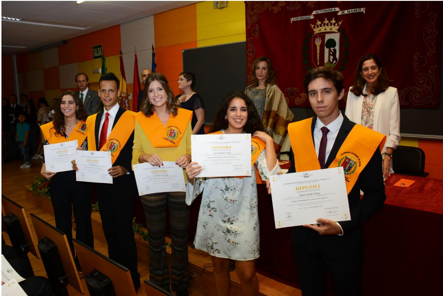
Acto de graduación · Grado en ADE. Oct. 2017